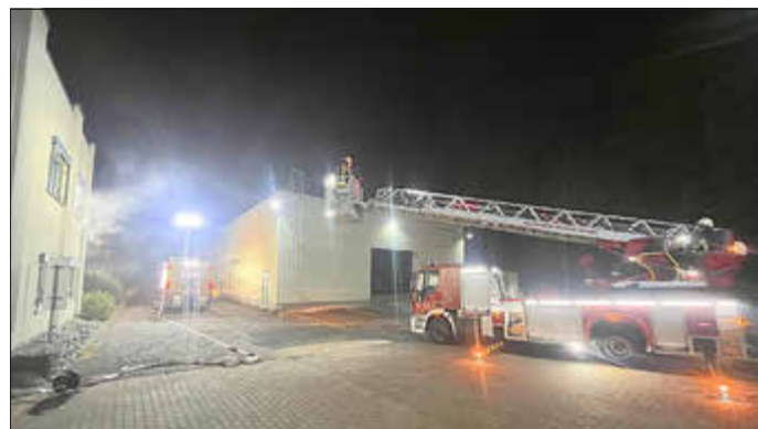
Drehleiter als Ausbildungseinheit