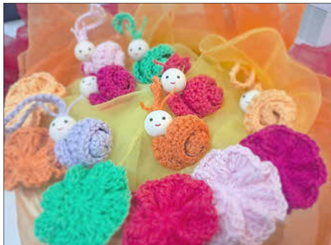
Zauberhaft sind die liebevoll gehäkelten Blumen und Schnecken, mit denen die DRK-Tagespflege Krakow am See nun überrascht wurde.

In der DRK-Tagespflege Krakow am See gibt es Momente, die besonders berühren und Herzen erwärmen. Eine wundervolle Spende einer Dame aus Krakow am See, die mit viel Liebe zum Detail und handwerklichem Geschick wahre Kunstwerke geschaffen hat, durften die Mitarbeitenden nun entgegennehmen.