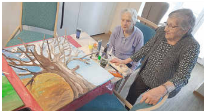
Die Tagesgäste erfreuen sich an dem neuen, gemeinsam gestalteten Geburtstagskalender.

Grundlage des Kalenders sind zwei bemalte Leinwände, auf denen Bäume zu sehen sind – jeweils passend zu Frühling, Sommer, Herbst und Winter gestaltet. Die Bäume tragen Blätter, die den einzelnen Geburtstagen zugeordnet sind. Je nach Jahreszeit unterscheiden sich Farben und Formen: zarte Grüntöne für den Frühling, kräftige Farben für den Sommer, warme Herbstnuancen und ruhige Winterakzente. Auf jedem Blatt ist der Name eines Tagesgastes sowie dessen Geburtstag vermerkt.