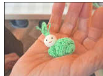
Ganz behutsam würden die Häkeltierchen von den Tagesgästen begutachtet.