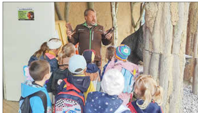
Viel Wissenswertes lernen die Kinder im Wildpark-MV.

Das Wildpark-Projekt im Güstrower Wildpark-MV hat bereits begonnen. Gemeinsam mit den Erziehenden sind die Kinder mit dem Linienbus nach Güstrow gefahren und so fing das Abenteuer schon an. Die Kinder haben sich riesig gefreut und waren sehr gespannt. Und es war wirklich sehr interessant! Die Kinder haben schon viel lernen und erfahren dürfen und haben mit ihrem Wissen über die Natur die Wildpark-Pädagogen begeistert. Wusstet ihr, dass der älteste Storch MVs im Wildpark „Glatze“ heißt und schon 45 Jahre alt ist? Die Grashüpfer wissen es jetzt. Sie kennen auch viele Nadel- und Laubbäume und wissen sogar, wie die Früchte der Bäume aussehen und wie sie heißen. Gemeinsam haben die Kita-Kinder die Braunbären Fred und Frode beobachtet, die Bärenhöhle besichtigen und die scheuen Eichhörnchen in ihrem Gehege besucht – ein tolles Erlebnis.