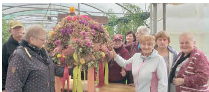
Die Kuchelmißer Frauen mit der prächtigen Erntekrone