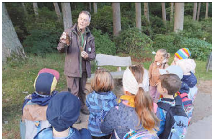
Aufmerksam folgen die Kinder der DRK-Kita Schneckenhaus den Ausführungen der Wildpark-Pädagogen.

Die DRK-Kita Schneckenhaus in Groß Grabow startete mit viel Kraft und Energie in das neue Kita-Jahr. Viele Höhepunkte, Spaß und Spiel erwarten die Kinder der DRK-Einrichtung in den kommenden Monaten und besonders auf die Vorschul-Grashüpfer warten tolle, lehrreiche Projekte, die die Kinder auf den Eintritt in die Schule vorbereiten werden.