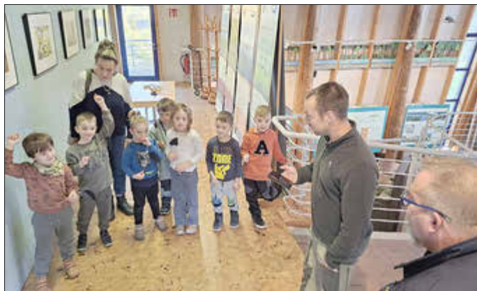
Viel Neues lernten Jung und Alt bei diesem Ausflug.

Anschließend wurden verschiedene Spiele rund um die Fledermaus gespielt, die nicht nur lehrreich, sondern auch sehr lustig waren. Alle waren mit Begeisterung dabei und konnten ihr neues Wissen kreativ umsetzen: In einem selbst gemalten Bild hielten sie ihre Eindrücke fest. Diese kleinen Kunstwerke durften am Ende stolz mit nach Hause genommen werden.