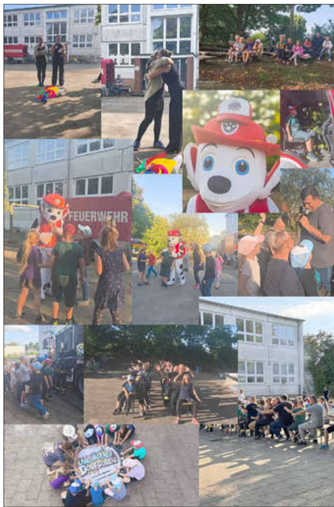
Eindrücke von unserer Party

Man kann nicht oft genug Danke sagen – Danke an alle, die uns immer unterstützt und an unsere Idee geglaubt haben. Auch ein riesengroßes Dankeschön an alle, die diesen Nachmittag möglich und unvergesslich gemacht haben.