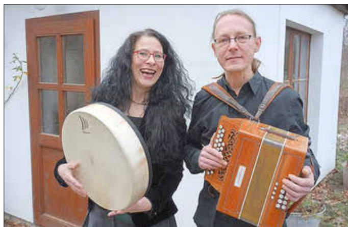
Duo Sveriges Vänner

In der dunklen Jahreszeit ist es gut, sich gemeinsam mit anderen an Schönem zu erfreuen. Auch der Kulturverein möchte mit seinen Angeboten seinen Beitrag dazu leisten.