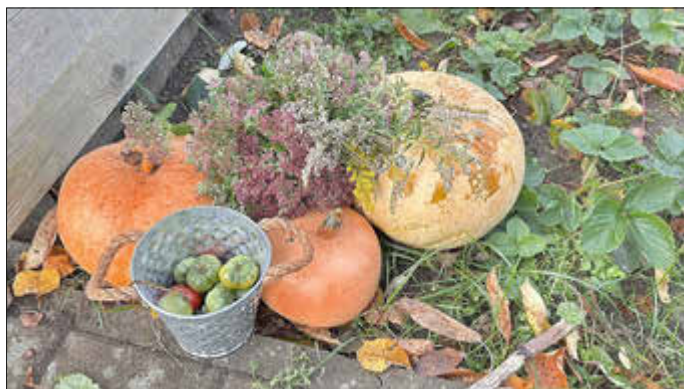
Hort der VS – Kita Krakower Zwerge Karoline Bobzien

Zum Abschluss können wir sagen unsere Herbstferien waren bunt und fröhlich.