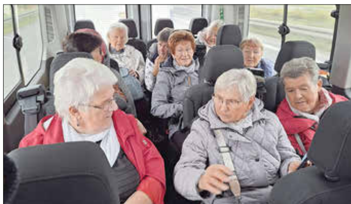
Schon im Bus kamen die Teilnehmenden aus Krakow am See schnell miteinander ins Gespräch