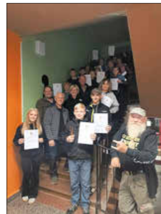
Fischereikursteilnehmer Anglerverein Krakow am See e.V.