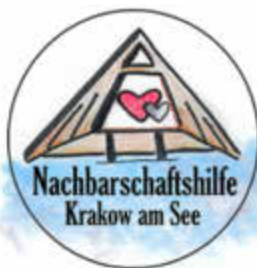
Logo: Anika Käding

Sehr geehrte Bürgerinnen und Bürger, gerne möchten die Akteure noch mehr in Anspruch genommen werden ... als bisher, auch über den Bereich Krakow hinaus. Zu erreichen sind sie per Tel.: 038457 51743 und Mail: Nachbarschaftshilfe.Krakow@gmx.de . Bitte nutzen Sie doch dieses bemerkenswerte Unterstützungsangebot bzw. reichen Sie die Informationen dazu im Freundes- oder Bekanntenkreis weiter.