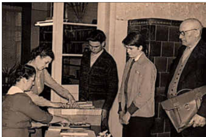
Buchausleihe in den 1960er-Jahren

Sie und ihre Kolleginnen betreuten anfangs 22 Außenstellen, später dann 12 Gemeindebibliotheken und 4 Ausleihstellen (POS, KBS, Klub der Volkssolidarität und Zeltplatz)