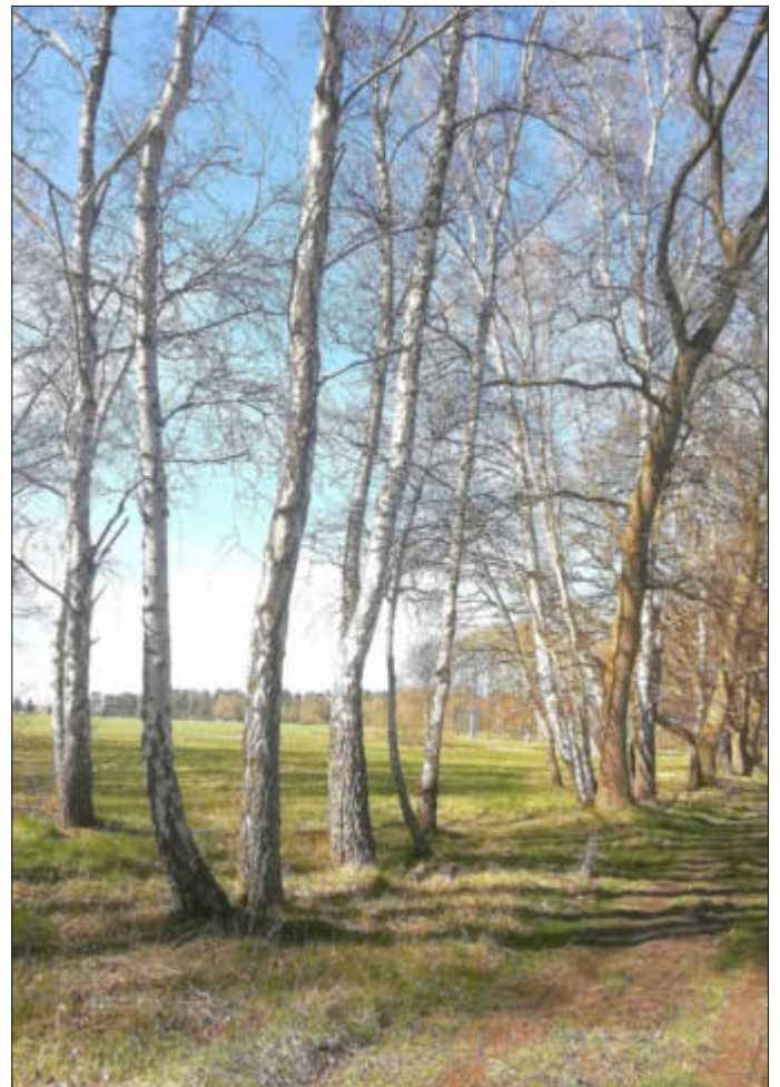
Ein lichtiges Bild - einladend - zwischen Winter und Frühling.

Leuchten! Sieben Wochen ohne Verzagtheit ist auch das Thema in diesem Gottesdienst. In der Passionszeit von Aschermittwoch bis Ostersonntag kommt beides vor: Die Finsternis von Leiden und Tod und das Licht der Auferstehung. Und dazwischen die Schattierung zwischen Hell und Dunkel, die dem Leben Kontur geben. Ein Gottesdienst auf den Spuren von Gottes Licht. Herzlich willkommen!