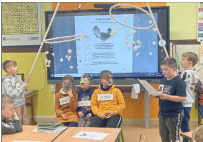
Beim Spatzen-Spiel haben alle Kinder Spaß.