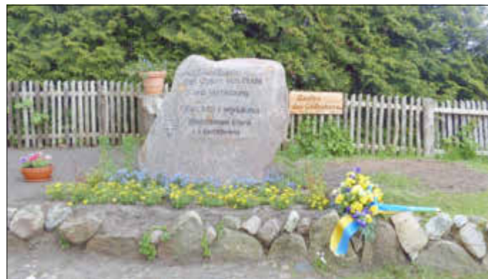
Garten des Gedenkens